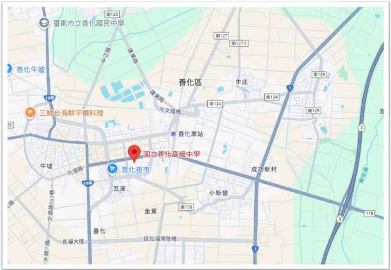
附圖一 承辦學校國立善化高中位置圖